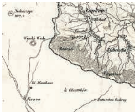
Droga z Łupkowa na Wyrawę na mapie z połowy XIX w.