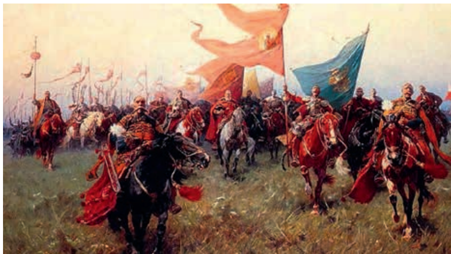
Józef Brandt (1841-1915), „Bogurodzica”, olej na płótnie, 1909, Muzeum Narodowe we Wrocławiu