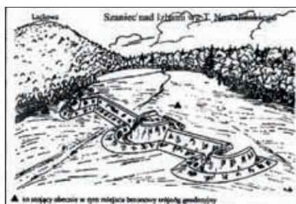
Szkic przykładowego szanieca