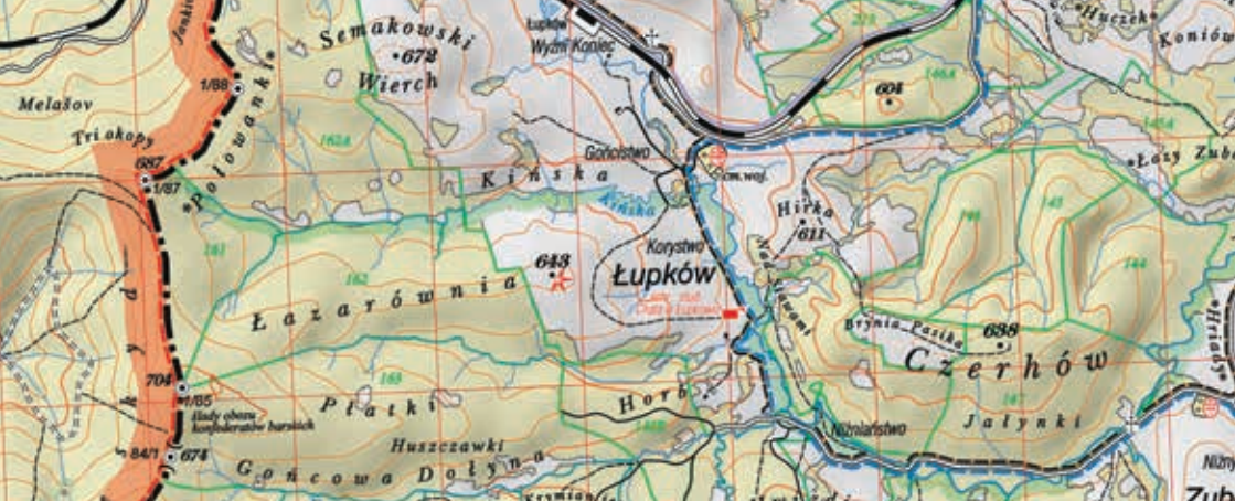
W. Krukar, „Mapa nazewnictwo-turystyczna Nadleśnictwo Komańcza”, 1:35 000, Krosno 2018 (fragment)