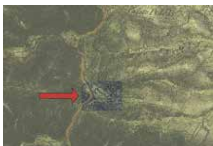
Lokalizacja obozu na austriackiej mapie wojskowej sporządzonej po 1839 r.

wanki (Polwanki). Po zejściu się dróg, przy szaniecu wiodła już jedna droga prowadząca przez grzbiet graniczny do Výravy. Droga ta miała istotne znaczenie, gdyż w razie niepowodzenia w boju, stanowiła ważną rokadę, pozwalającą na wycofanie się za granicę i przegrupowanie oddziałów dla obsadzenia i wzmocnienia załogi któregoś z sąsiednich obozów.