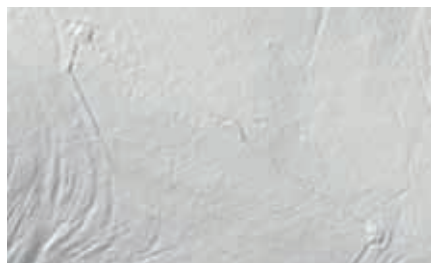
Ślady umocnień ziemnych obozu konfederatów

się z dwóch odcinków o dł. 25 i 72 m, połączonych na załamaniu. Tym samym tworzą one częściową osłonę szańca w partii północno-zachodniej. Prawa kurtyna jest krótsza (ok. 38 m) i została wytyczona niemal pod kątem prostym do kurtyny czotowej. Aby umożliwić dogodny odwrót i szybki odjazd, tylna strona obiektu nie była ufortyfikowana. Po raz pierwszy dość wierny wizerunek obozu pod Łupkowem został zamieszczony i podpisany jako „Alte Schanz” w tzw. mapach Miega, sporządzanych w latach 1779-1783.